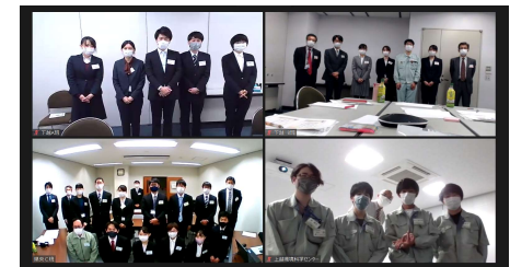
ZOOMを使用したグループディスカッションの様子と 研修会終了後、参加者全員カメラ前に集合して